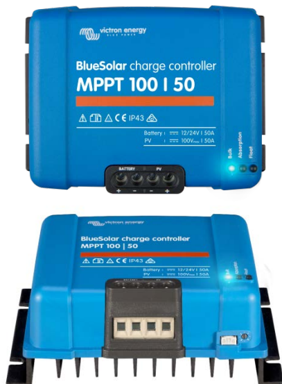
Controlador de carga solar MPPT 100/50